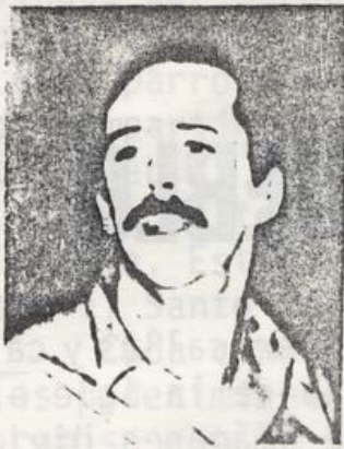
EL MIR, EN LA SENDA DE MIGUEL

bierno democrático, popular y revolucionario. Durante estos trece años nuestro Partido ha cometido errores y ha sufrido reveses. Pero no ha caído ni caerá en el desaliento. Los errores los ha corregido y las derrotas parciales las ha superado.